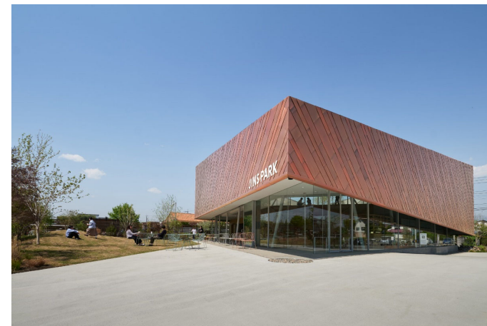
JINS PARK 前橋 ©阿野太一 + 楠瀬友将