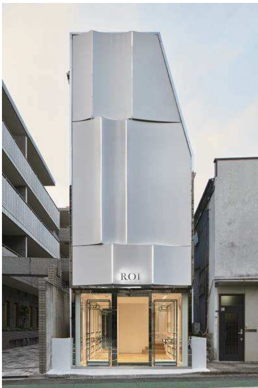
2018 ROI Showroom

ITRI(工業技術研究院), SHIBUYA CAST, HOUSE IN TODOROKI, ROI Showroom